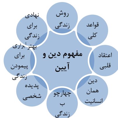
شکل ۱-۱ مفهوم دین و آیین

شرکت کننده ها در مصاحبه برای مفهوم آیین بیاناتی داشتند که حد وسط آن را می توان چهارچوب و ابزار زندگی قرار داد. با توجه به آراء شرکت کننده ها، طبقات توصیفی و فضای نتیجه به دست آمده از تحلیل مصاحبه ها در ارتباط با سؤال نخست به قرار زیر است: