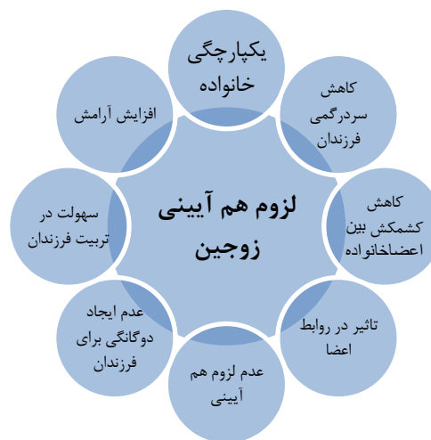
شکل ۱-۲: لزوم هم آیینی زوجین

با این پیش زمینه طبقات توصیفی و فضای نتیجه به دست آمده از تحلیل مصاحبه ها با مشارکت کنندگان در ارتباط با سؤال دوم به قرار زیر است: